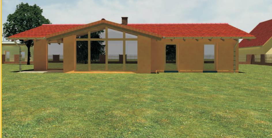
Variantní řešení 2